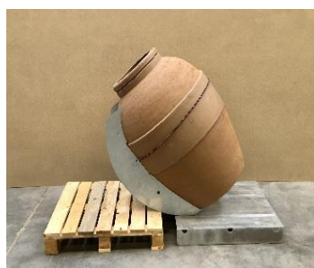
<< Sklopný stojan (vyprázdňovanie, umývanie)