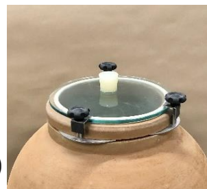
Poklop z 12 mm tvrdeného skla >> (vizuálny efekt, dobrá tepelná izolácia)