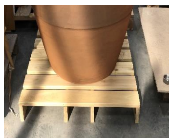
Odolná podložka z agátu >>