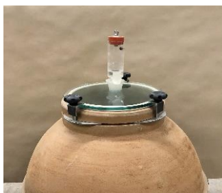
<< Akrylová kvasná zátka