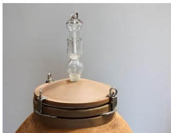
<< Terakotový poklop (dobrá tepelná izolácia)