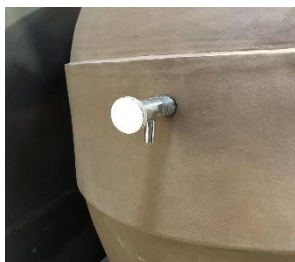
<< Degustačný ventil