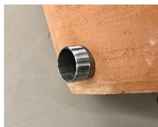
Spodný výpustný ventil >>