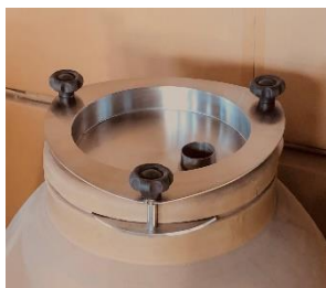
<< Zapustený nerezový poklop (bez vzduchovej bubliny)