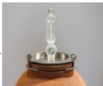
Sklenená kvasná zátka >>