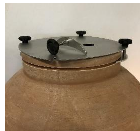
Plochý nerezový poklop >> (ľahká údržba)