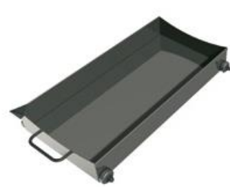
OXOline¹ podlahová vanička

Táto nerezová vanička sa používa na zber kalov po stočení vín a odkvapkovanie vody po umytí sudov pre sudy uložené na spodnom poschodí.