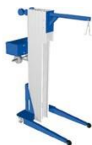
OXO Mini Lift

Tento zakladač umožňuje bezpečnú manipuláciu s prázdnyimi sudmi. Po vložení zdvihacieho háku do otvoru zátky je možné sudy umiestniť alebo vyťahnúť na OXOline2 a OXOline1 až do výšky 6 poschodí.