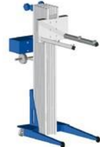
OXO Super Lift

Tento zakladač umožňuje bezpečnú manipuláciu s prázdnyimi sudmi. Po vložení zdvihacieho háku do otvoru zátky je možné sudy umiestniť alebo vyťahnúť na OXOline2 a OXOline1 až do výšky 6 poschodí.