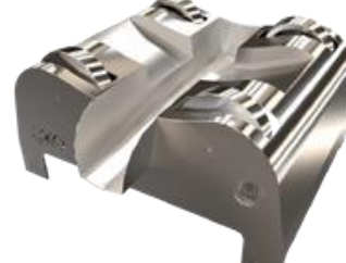
Monoblok nerez M600

Táto nestohovateľná individuálna podpera z nehrdzavejúcej ocele je ideálna na skladovanie sudov s objemom 400 až 600 L na jednej úrovni. Integrované valčeky umožňujú jednoduché otáčanie sudov hlavne pri miešaní kalov. Plné sudy sa dajú ľahko presúvať priamo na stojane pomocou paletového vozíka.