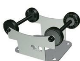
Monoblok - 4

Táto zátka umožňuje rotáciu sudov na systémoch OXOline®. Tým sa uľahčuje práca s miešaním na kaloch, alebo homogenizácia rmutu pri kvasení červeného vína. Samozrejme sa tieto zátky dajú použiť aj pri bežnom vyzrievaní vína.