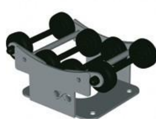
Monoblok - 8

Táto nestohovateľná individuálna podpera z nehrdzavejúcej ocele je ideálna na skladovanie sudov s objemom 225 až 300 L na jednej úrovni. Integrované valčeky umožňujú jednoduché otáčanie sudov hlavne pri miešaní kalov. Plné sudy sa dajú ľahko presúvať priamo na stojane pomocou paletového vozíka.